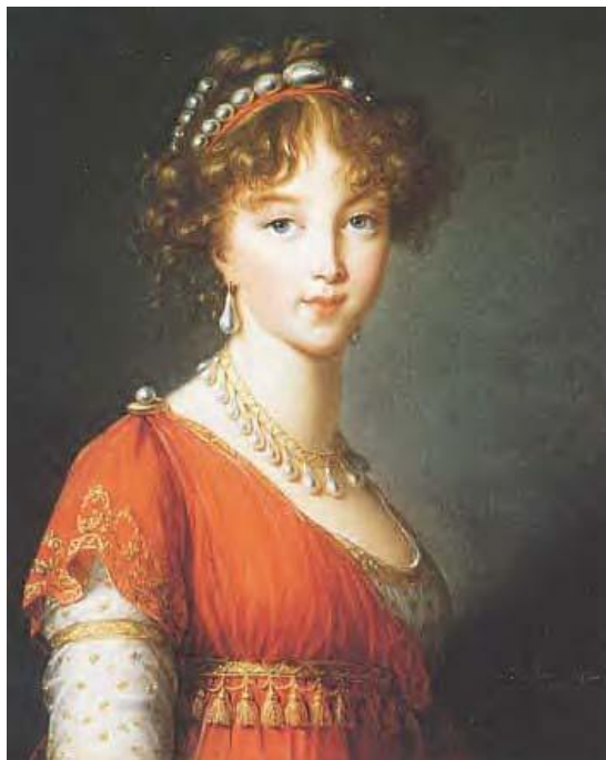
Луиза Мария Августа Баденская (в православии – Елизавета Алексеевна) Брак принес двух дочерей, которые умерли в раннем возрасте.