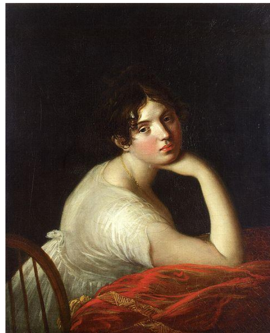
15 лет Александр I имел практически вторую семью с Марией Нарышкиной, которая родила ему троих детей.