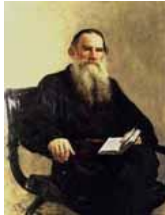
Портрет: Л. Н. Толстой. Художник И. Репин