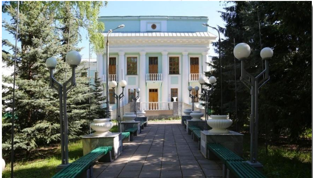
Корпус «А» Чувашского государственного университета им. И.Н. Ульянова.

В городе Чебоксары сохранились здания, которые принимали военные подразделения. Так в первоизданном виде сохранилось здание, в котором размещался один из батальонов 8-го телеграфного полка.