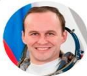
Председатель РЯЗАНСКИЙ СЕРГЕЙ НИКОЛАЕВИЧ

Герой Российской Федераций, летчик-космонавт