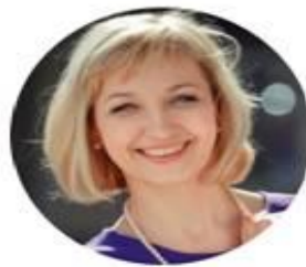
Сопредседатель ГОЛОВЕНЬКИНА АЛЛА НИКОЛАЕВНА

Герой Российской Федераций, летчик-космонавт