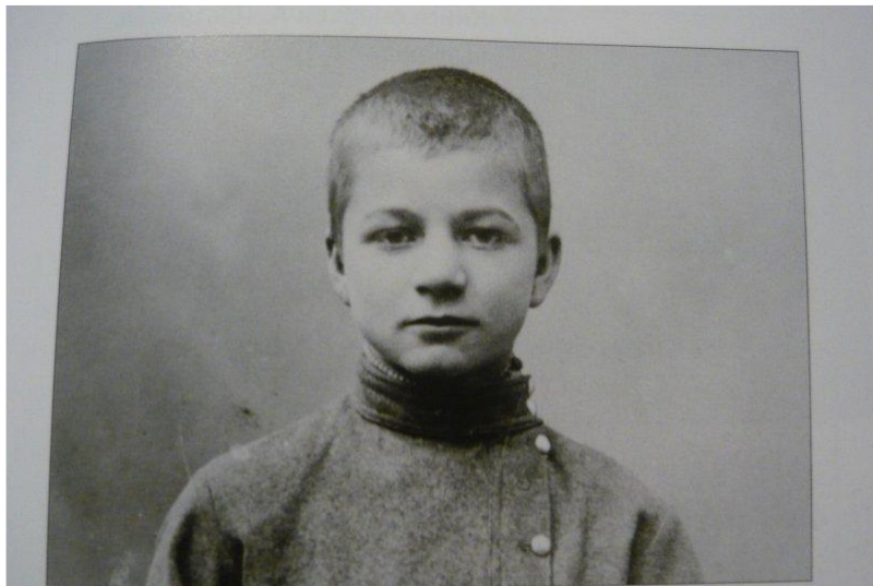
Андрей Климентов. Около 1909

Андрей Платонович Климентов, которого читатель знает под фамилией Платонов, родился 28 (16) августа 1899 года.