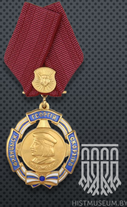
Орден Франциска Скорины