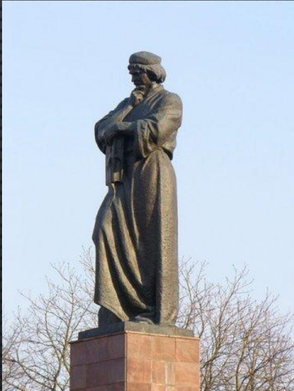
Памятник в Полоцке