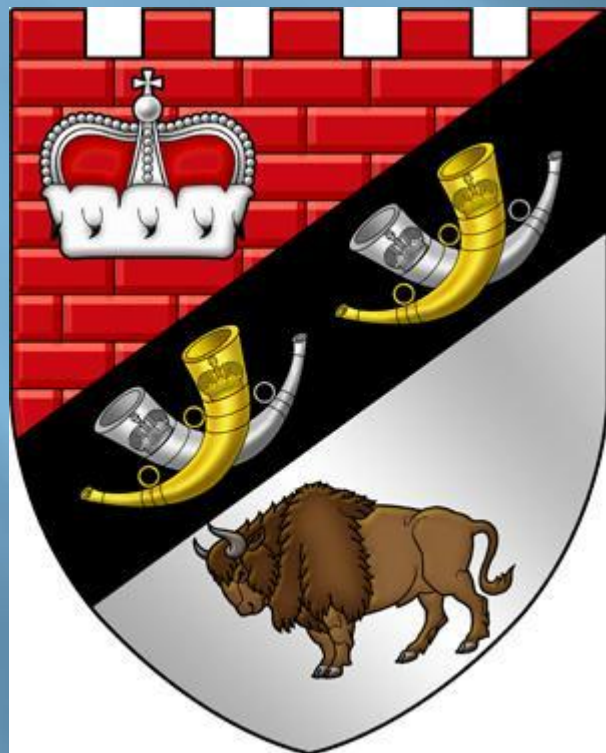
ГЕРБ БЕЛОВЕЖСКОЙ ПУЩИ

Основана в 1939 году на базе исторически сложившейся заповедно охраняемой территории