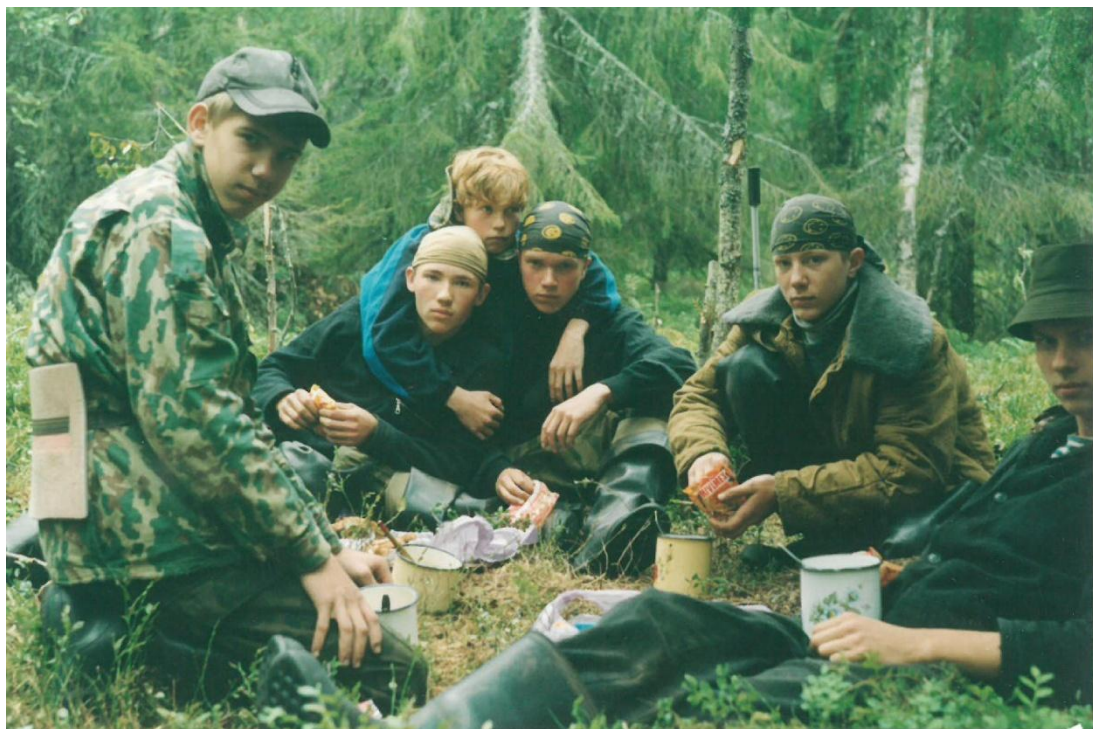
Карелия, 2002 год