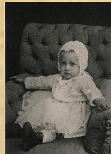
А. Ахматова в детстве