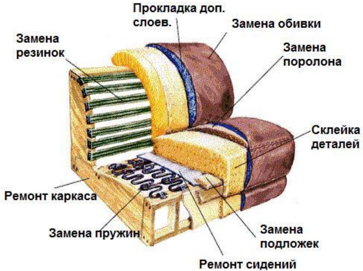
Схема ремонта дивана