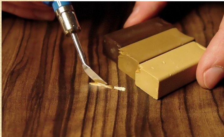
Специальные восковые мелки под цвет мебели

Мелкие царапины могут быть достаточно легко устранены специальными карандашами или маркерами для ретуши. Также для этого используют лак, эмаль в тон основного цвета изделия, морилку и т.д.