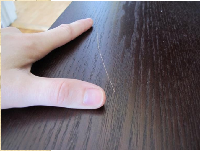
Мелкие царапины и потёртости