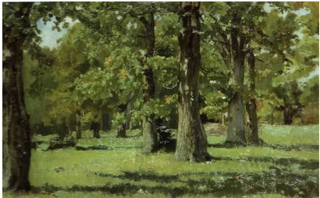
В.М.Васнецов «Дубовая роща в Абрамцево»