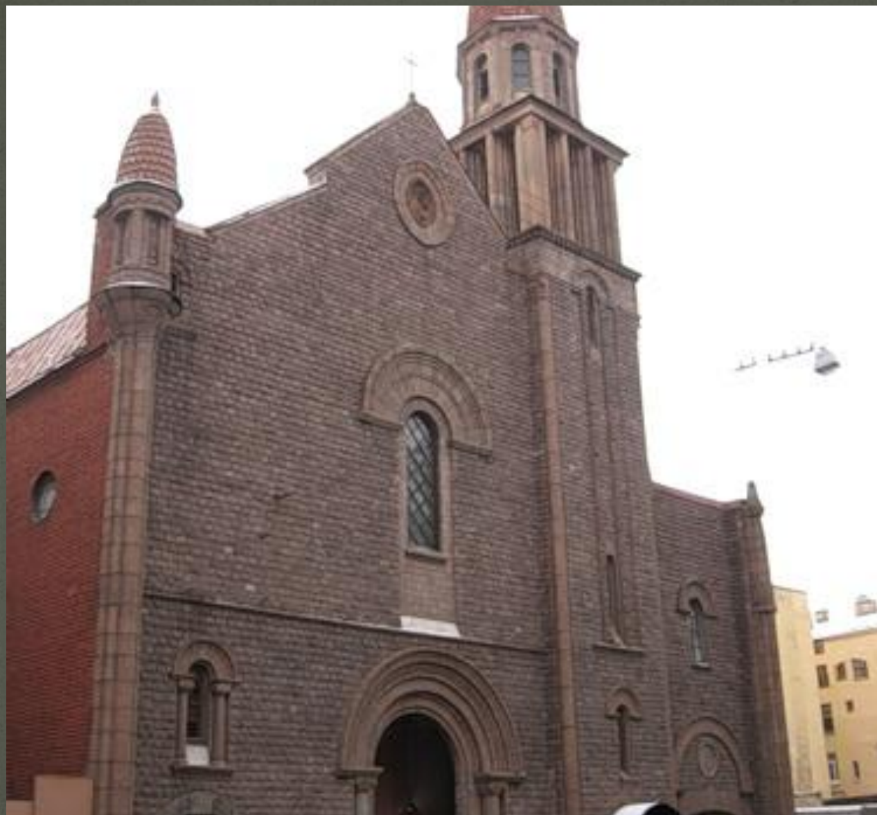
Собор Лурдской Божьей Матери