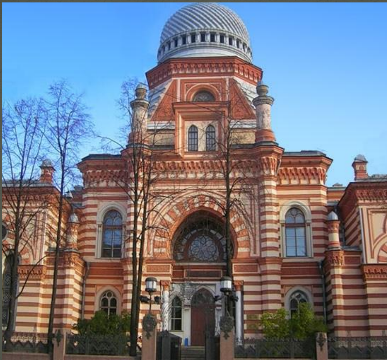
Большая хоральная синагога