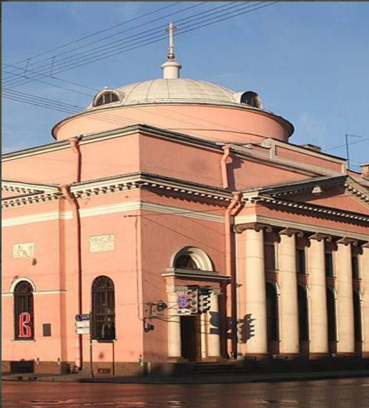
Храм иконы Божией Матери «Всех скорбящих Радость» на Шпалерной улице