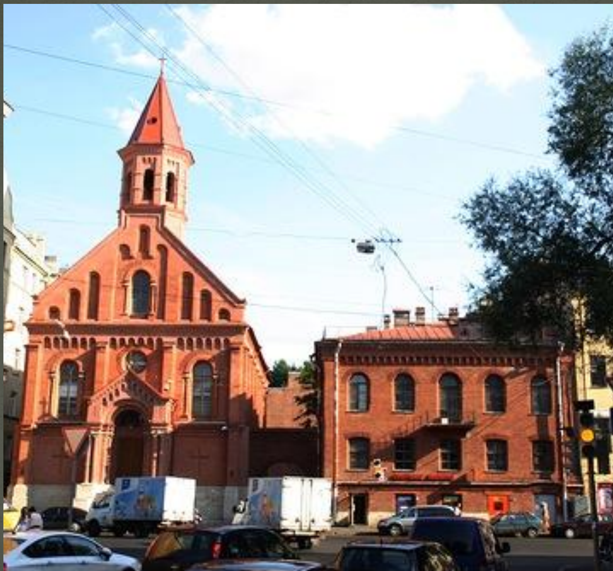
Эстонская церковь святого апостола