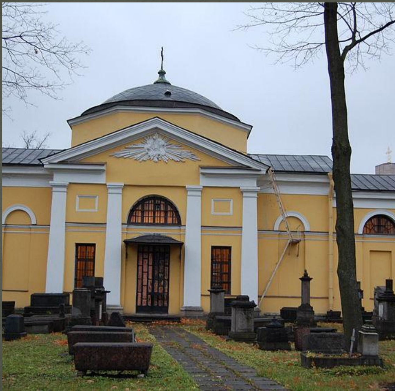
Смоленское армянское кладбище (церковь Воскресения Христового)