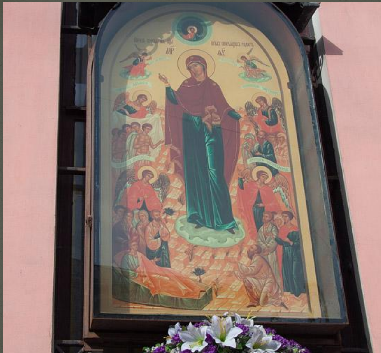
Икона Божией Матери «Всех скорбящих Радость»