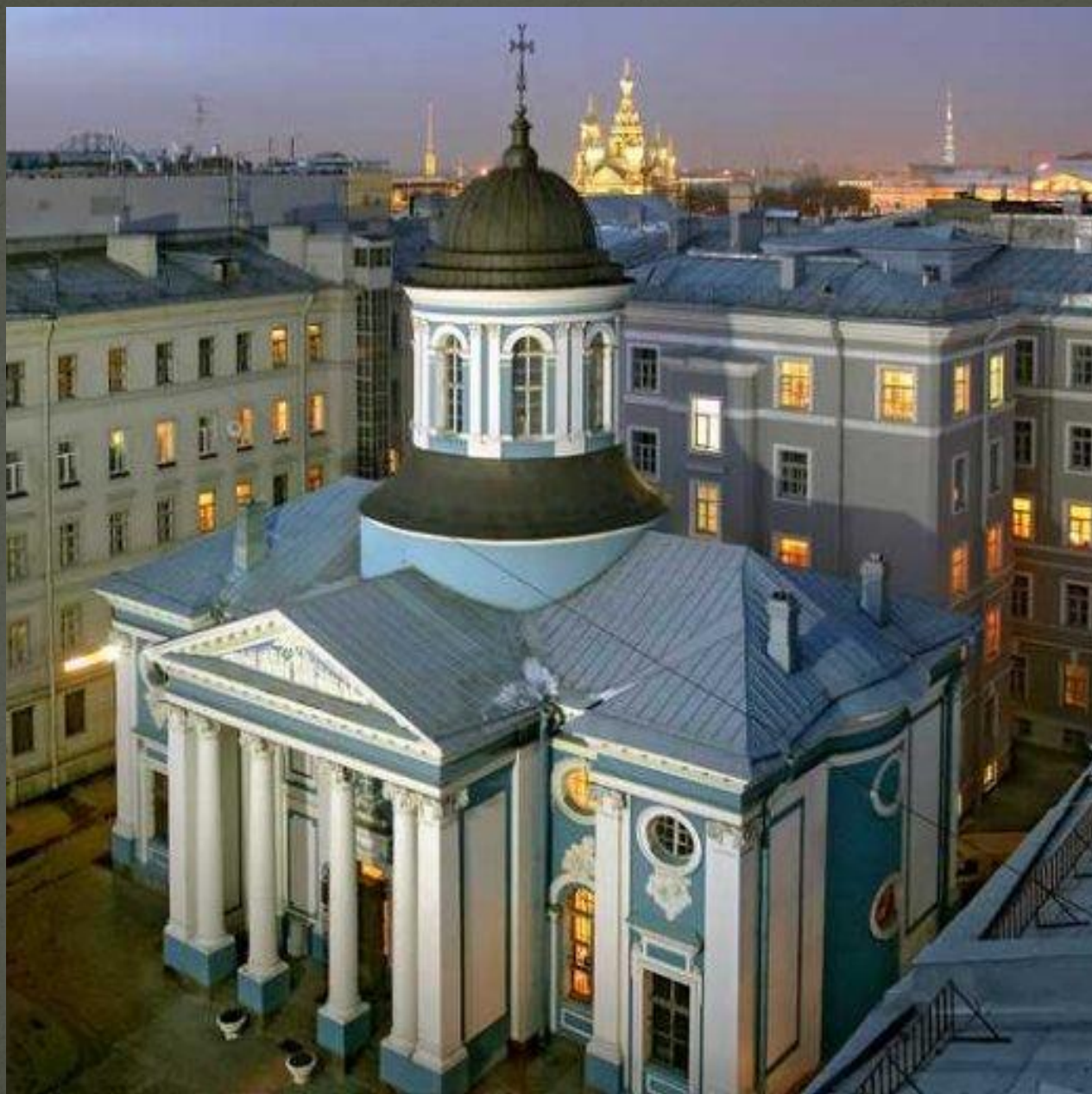
Армянская церковь Святой Екатерины