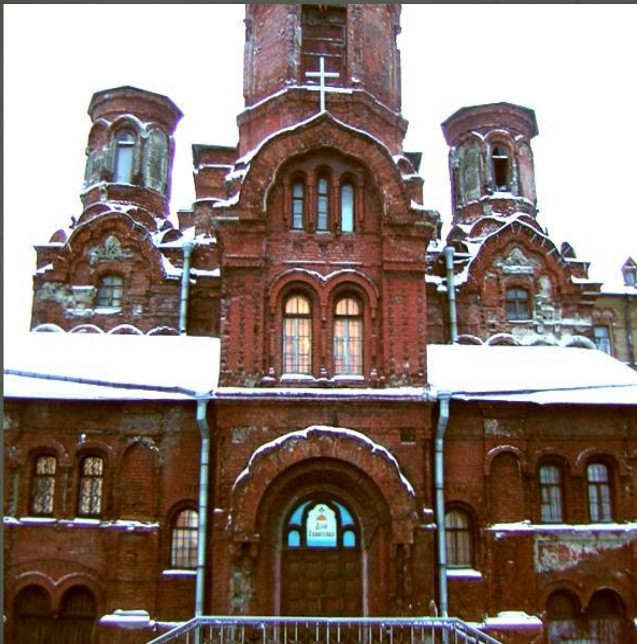
Церковь Покрова Святой Богородицы Епархиальн ого Братства Пресвятой Богородицы