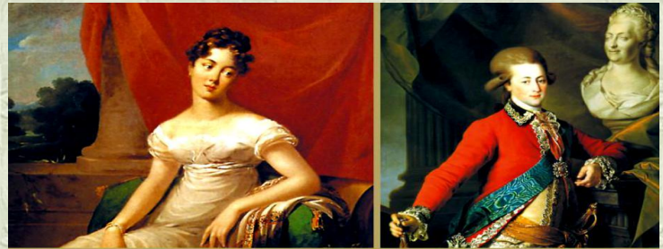
Капитанская дочка Александр Пушкин