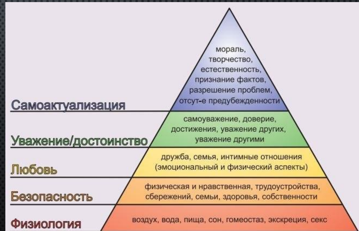
Концепция А. Маслоу иерархии потребностей в мотивации человека

Чем обусловлено наше поведение? По мнению Абрахама Маслоу, психолога-гуманиста, мотивация для наших действий заложена в необходимости удовлетворить определённые потребности. Маслоу впервые представил свою концепцию иерархии потребностей в работе «Теория человеческой мотивации» (1943) и в последовавшей за ней книге «Мотивация и личность». Эта иерархия предполагает, что люди стремятся вначале удовлетворить базовые потребности, и лишь потом перейти к другим. Эта иерархия чаще всего изображается в виде пирамиды (хотя в самой работе Маслоу её не было) — нижние уровни пирамиды состоят из простых потребностей, в то время как более сложные располагаются на вершине. В основании пирамиды лежат базовые физические потребности — в пище, воде, сне или тепле. После того, как эти потребности удовлетворены, люди переходят к следующему уровню — потребностям в надёжности и безопасности.