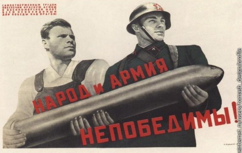
282. Корецкий В. Народ и армия непобедимы! 1941

САМОТВЕРЖЕННЫМ ТРУДОМ ВЫСОЧАЙШИМ КАЧЕСТВОМ И ПОЛНОМ ОТВЕТСТВЕННОМ ДОВОДИМ ДО ПОБЕДЫ НАШ ВРАГОВ