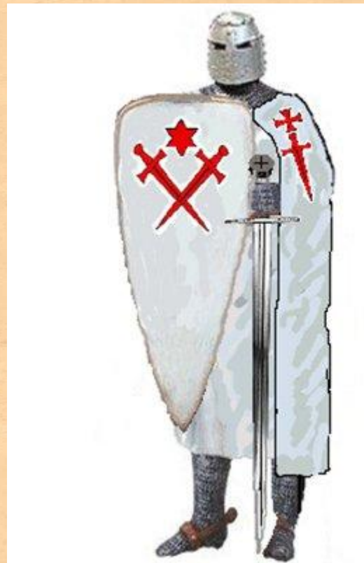
Орден Меченосцев 1202г.