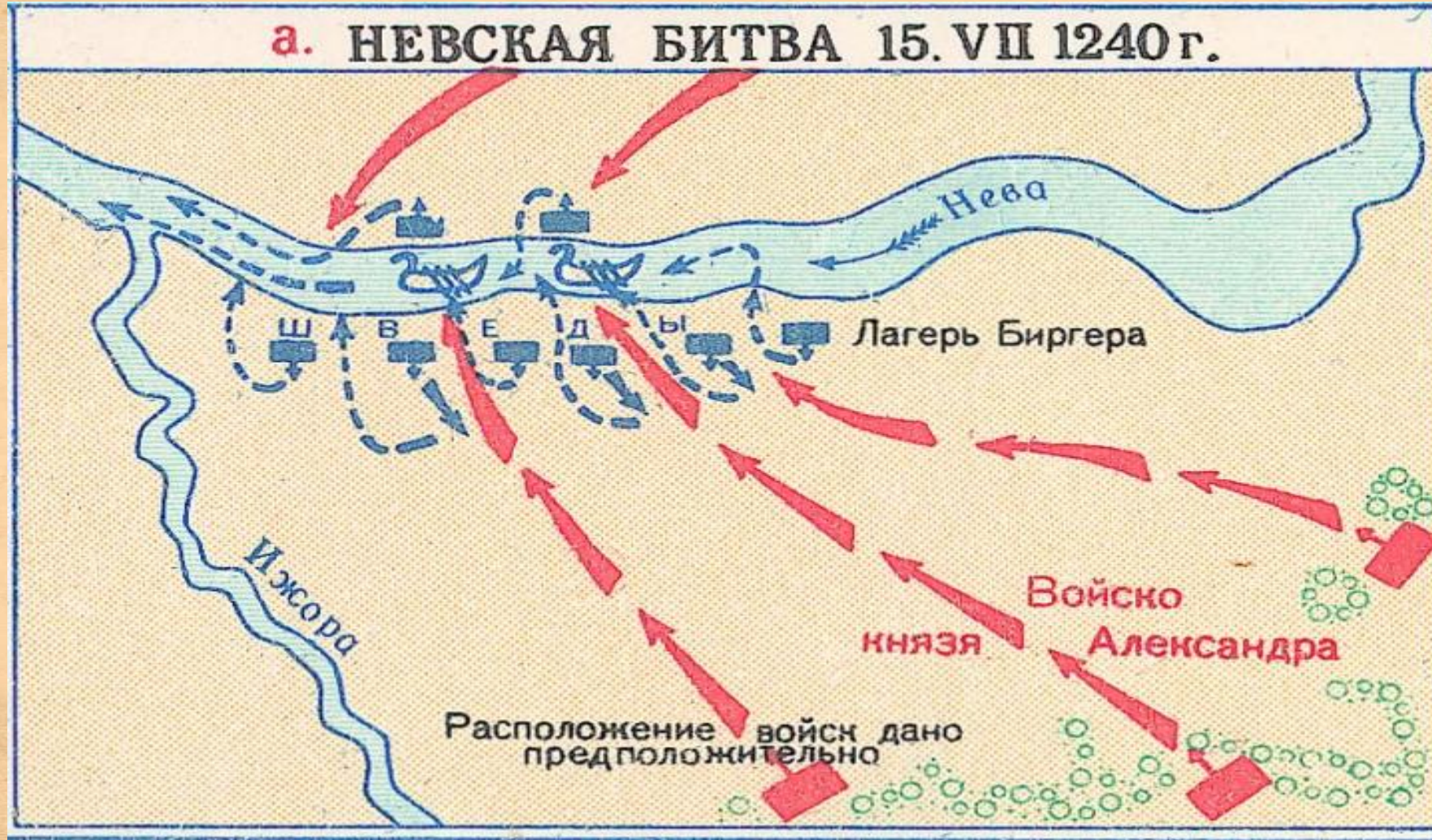
а. НЕВСКАЯ БИТВА 15. VII 1240 г.