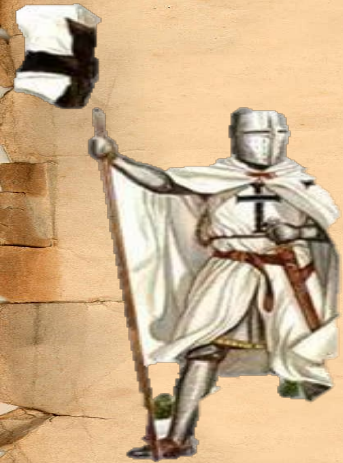
Тевтонский орден 1191г.