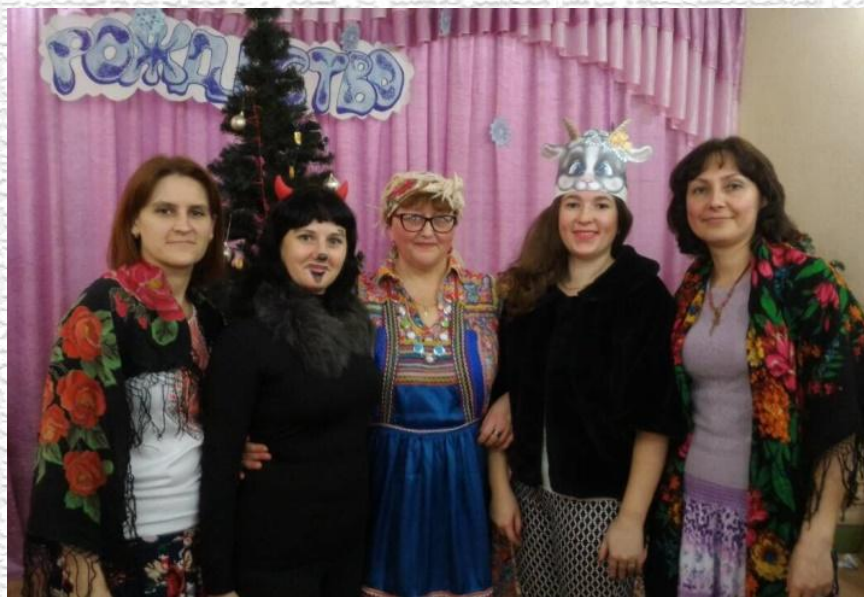
«У рождественского самовара»