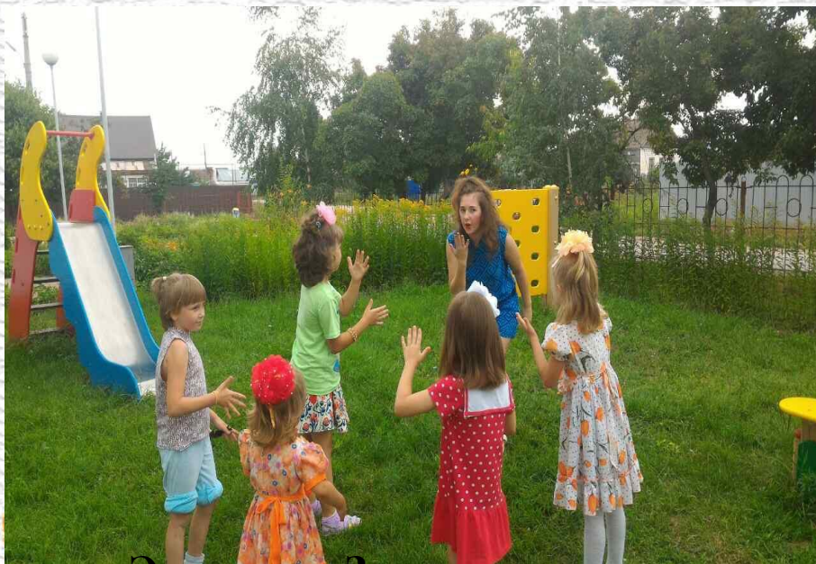
Экоквест «Знатоки природы»