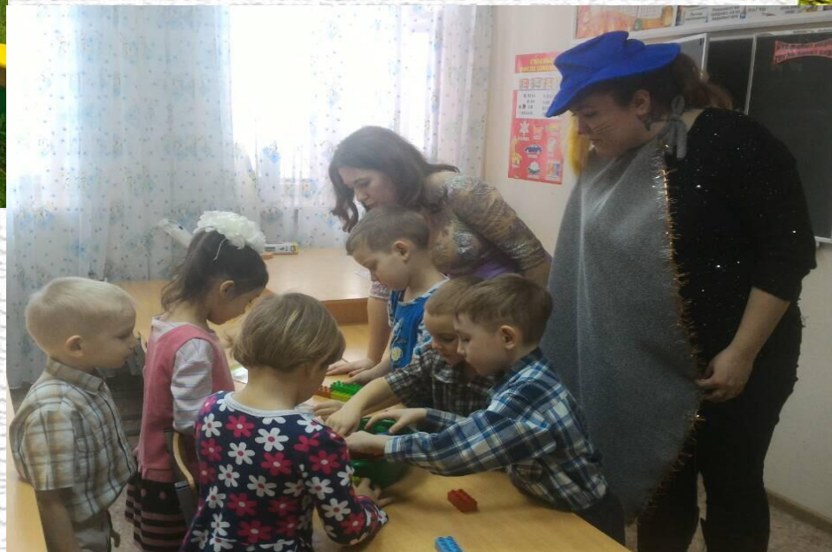
Квест «В поисках сказок Ш. Перро»