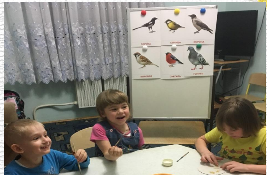
«Покормите птиц зимой»