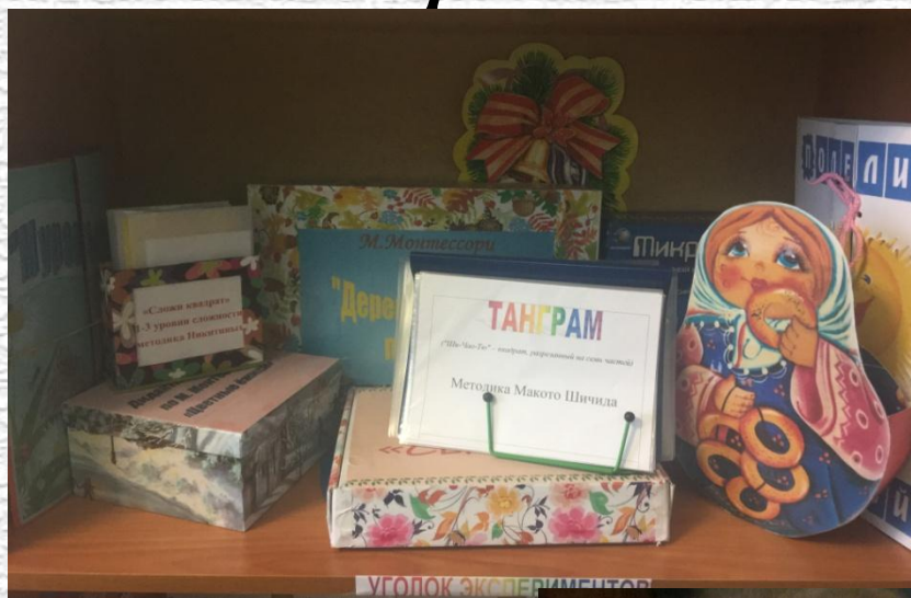
М. Монтессори «Семена»