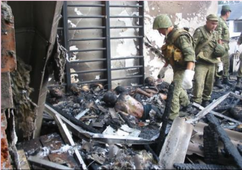
Beslan, Russia (09/01/2004)