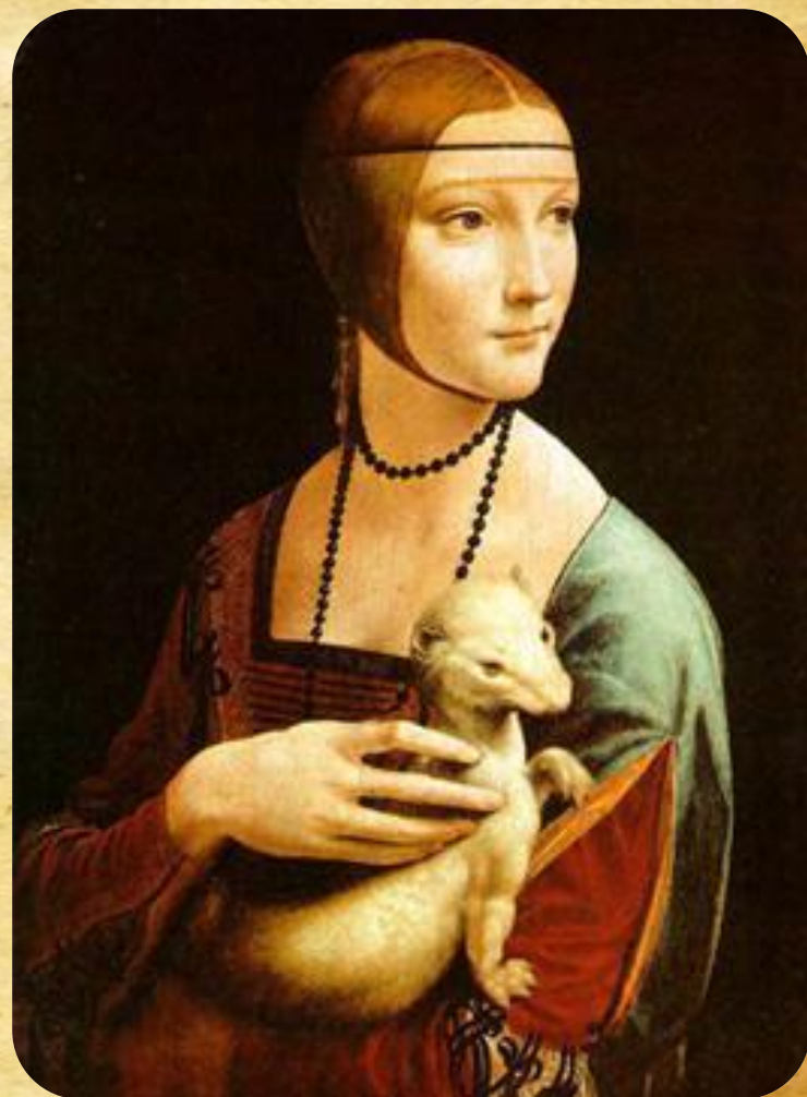
Дама с горностаем

«Дама с горностаем»- картина, принадлежащая кисти Леонардо да Винчи. По мнению многих исследователей, это портрет Чечилии Галлерани — девушки Лодовико Сфорца по прозвищу Иль Моро, герцога миланского, что находит подтверждение в сложной символике картины. Наряду с «Моной Лизой», «Портретом Джиневры де Бенчи» и «Прекрасной Ферроньерой» полотно принадлежит к числу четырёх женских портретов кисти Леонардо. С одной стороны горностай - намек на фамилию Сесилии, 'Galleriani'- произносится похоже на греческое слово 'galee'(горностай). С другой - это маленькое существо в Милане, в то время, считался символом чистоты, достоинства и скромности, поскольку, согласно легенде, ненавидело грязь и ело только один раз в день.