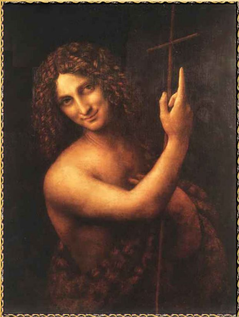
Святой Иоанн Креститель

Картина «Святой Иоанн Креститель» задумана художником в начале 1500-х годов, о чем говорит набросок ангела с поднятой рукой в позе Иоанна, приколотый к листу, датируемому примерно 1504. Леонардо начал над ней работать во время своего второго пребывания в Милане и продолжил работу в Риме. Видимо, по мнению самого мастера, полотно так и не было закончено. С темного пространства картины светлым силуэтом на нас смотрит фигура юноши с поднятой рукой и прижатым к телу крестом. Мягко мерцающие в темноте струящиеся локоны обрамляют это прекрасное лицо с загадочно зовущей улыбкой и неподвижным взглядом обведенных темными тенями глаз. В чертах лица явно читается схожесть с Монной Лизой, придающая ему несколько двусмысленный характер. Крест, как бы растворенный в пространстве картины, говорит нам, что перед нами