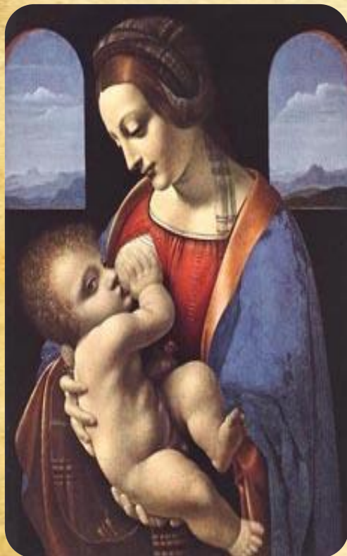
Мадонна Литта 1490-1491

Вновь обратившись к образам мадонны и младенца, мастер, постоянно решавший новые задачи, ставит перед собой уже другую цель. Если в «Мадонне с цветком» он добивался основанной на научном познании мира жизненной достоверности в изображении матери с младенцем, то теперь стремится к еще большей обобщенности и воплощению черт идеально прекрасного человека.