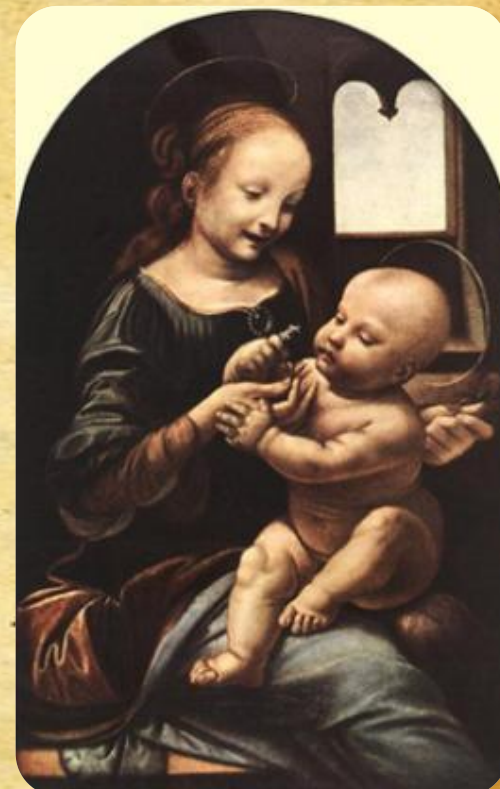
Мадонна Бенуа 1478—1480

Вновь обратившись к образам мадонны и младенца, мастер, постоянно решавший новые задачи, ставит перед собой уже другую цель. Если в «Мадонне с цветком» он добивался основанной на научном познании мира жизненной достоверности в изображении матери с младенцем, то теперь стремится к еще большей обобщенности и воплощению черт идеально прекрасного человека.