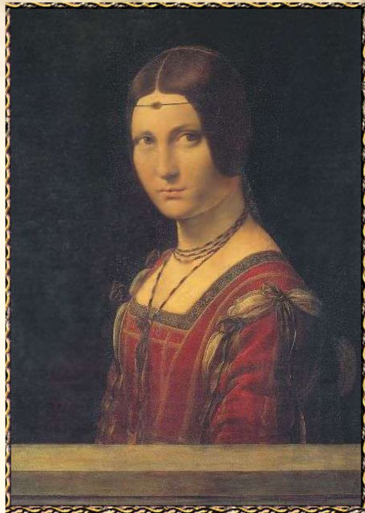
Портрет Неизвестной (Ла Белл Феррониер)

Может быть, Леонардо был вынужден сделать традиционный портрет по прихоти заказчика. Другой возможный ответ - то, что это была объединенная работа, выполненная несколькими