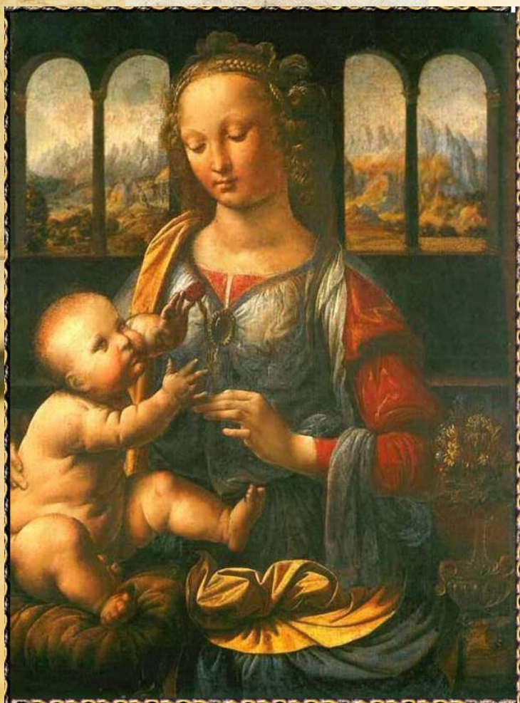
Мадонна с гвоздикой

Мадонна дель Гарофано, или дель Фьори ("с гвоздикой" или "с цветком") написана в ранний период творчества. Изображение Мадонны и младенца Иисуса, ясно показывают преданность методам, принятым в мастерской Верроккио. Такие Мадонны, были широко распространены в 15-ом столетии во Флоренции.