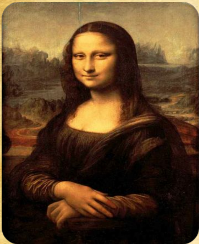
Леонардо да Винчи Портрет госпожи Лизы Джокондо Мона Лиза, 1503—1519

«Мона Лиза», она же «Джоконда» — картина Леонардо да Винчи, находящаяся в Лувре одно из самых известных произведений живописи в мире, которое, как считается, является портретом Лизы Герардини, супруги торговца шёлком из Флоренции Франческо дель Джокондо, написанным около 1503—1505 года.