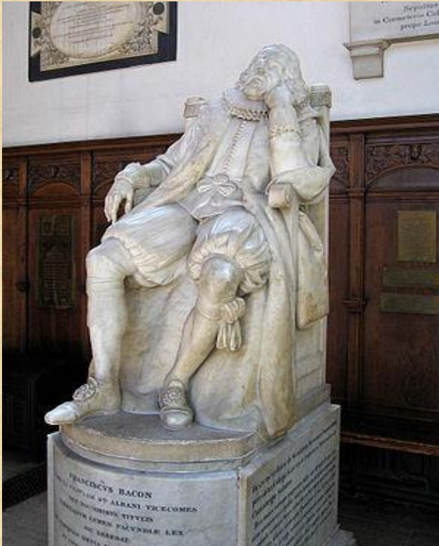
Статуя Бэкона в часовне Тринити-колледжа в Кембридже (Великобритания)

«Чтение делает человека знающим, беседа — находчивым, а привычка записывать — точным».