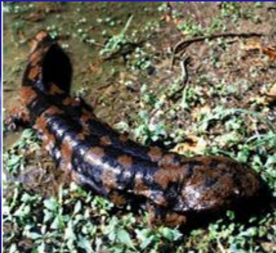
Китайская исполинская саламандра

Длина тела 10 – 28 см. Для них характерны зубы на челюстях, хорошо развитые веки, у взрослых особей есть лёгкие. Тело саламандр плотное, хвост короткий, конечности сильные, короткие, на передних 4 пальца, на задних – 5. Населяют сырые, тенистые леса, берега горных рек. Питаются мелкими беспозвоночными. Многие виды яйцеживородящие и живородящие.