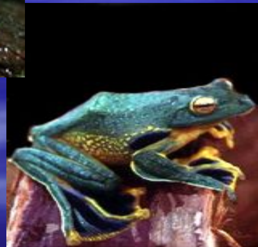
Чернолапая летающая лягушка