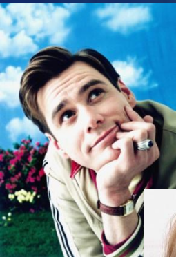
Джим Керри - Труман Бёрбанк

Работает страховщиком, его жизнь оказалась настоящим нон-стоп TV шоу