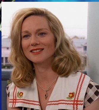
Лора Линни – Мэрил Бёрбанк

Работает страховщиком, его жизнь оказалась настоящим нон-стоп TV шоу