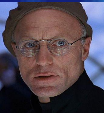
Эд Харрис – Кристоф

Даже его вечно шипящая жена – оказалась актрисой по контракту.