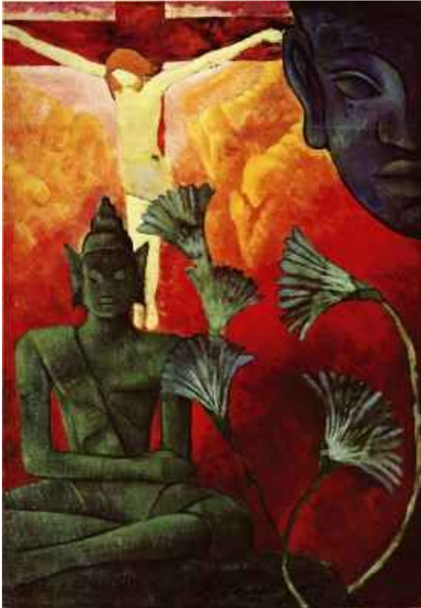
Христос и Будда. Около 1890