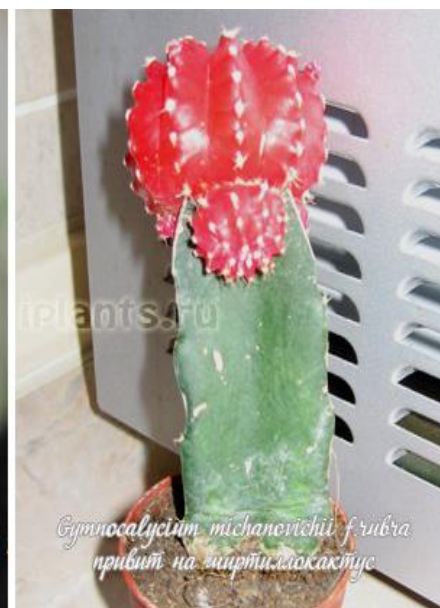
Gymnocactus michanovichii f. rubra привит на ширтилокактус