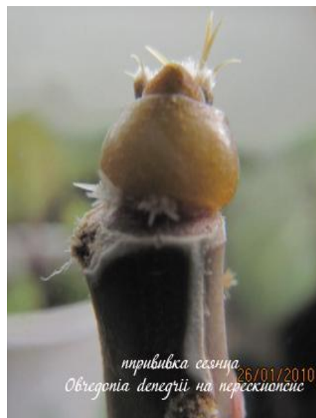
прививка сегмента 26/01/2010 Обregonia denegrii на перескионис