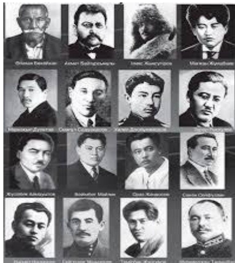
Деятели партии «Алаш»