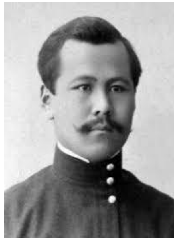
Мустафа Шокай 1918 г