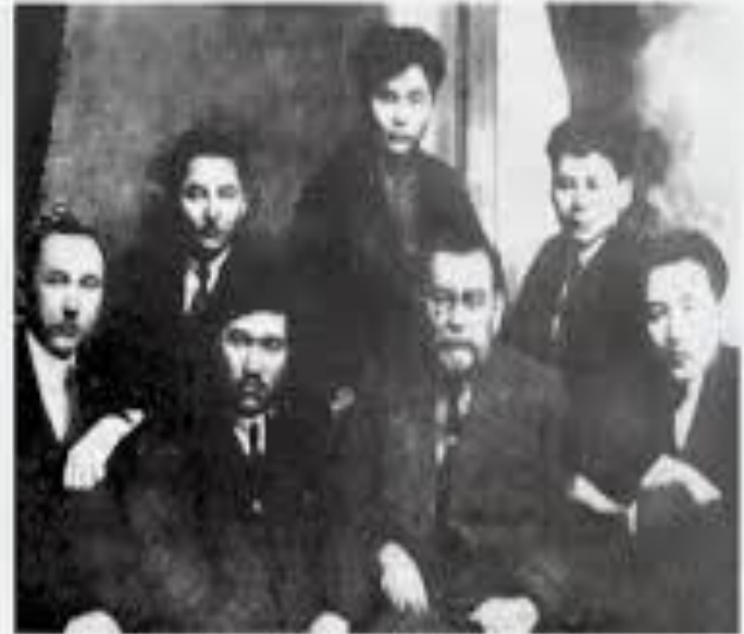
Солдан оңға қарай: Х. Ғаббасов, Ж. Аймауытов, М. Дулатов, Ә. Марғұлан, А. Байтұрсыннов, А. Байтасов, М. Әуезов. Қызылорда, 1926 ж.