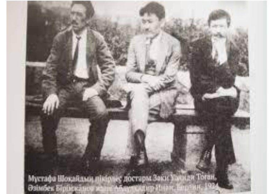
Мустафа Шокай Азимбек Б 1924г