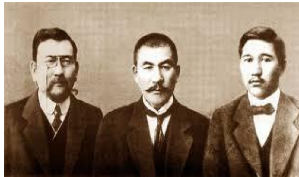
-Алихан Букейханов, А.Байтурсынов, М.Дулатов 1917 г