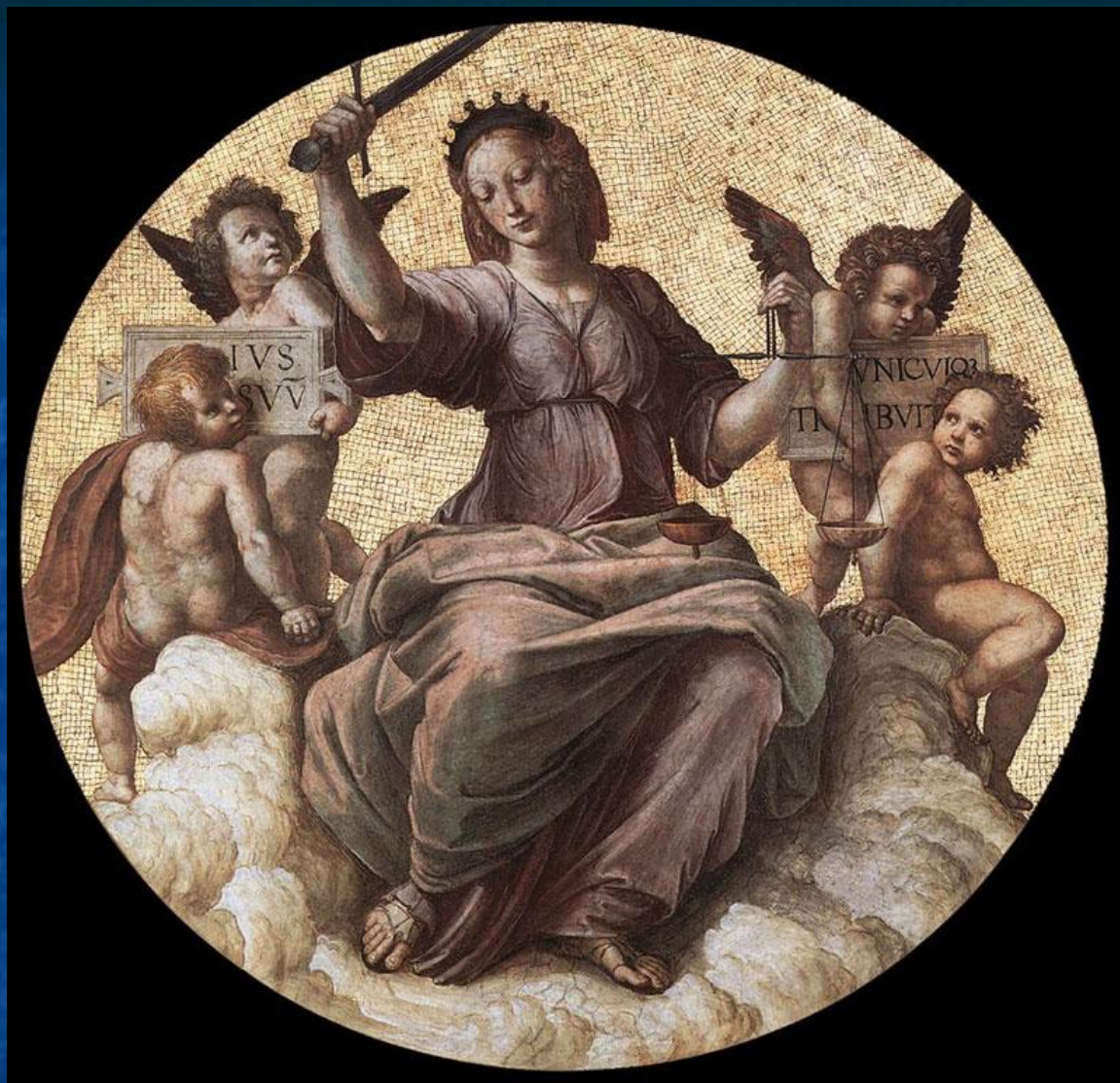
Правосудие Рафаэль Санти, 1509-1511 Рим, музеи Ватикана