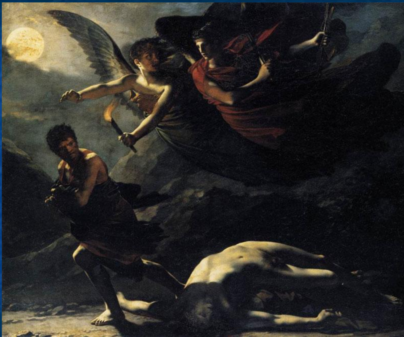
Пьер-Поль Прюдон, 1808 Париж, Лувр