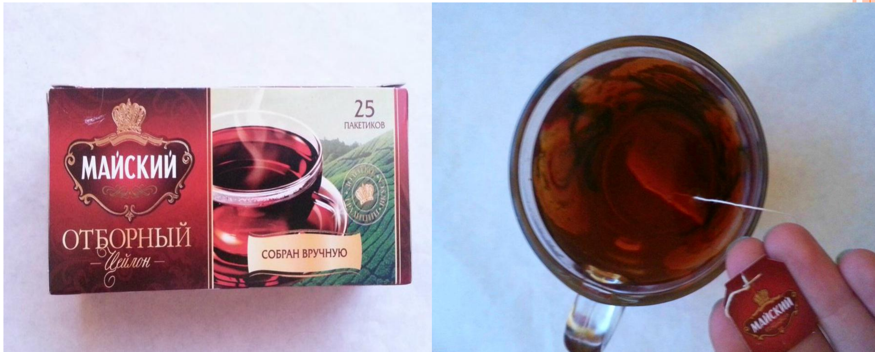
Чай черный «Майский» цейлонский, изготовитель ООО «МАЙ»