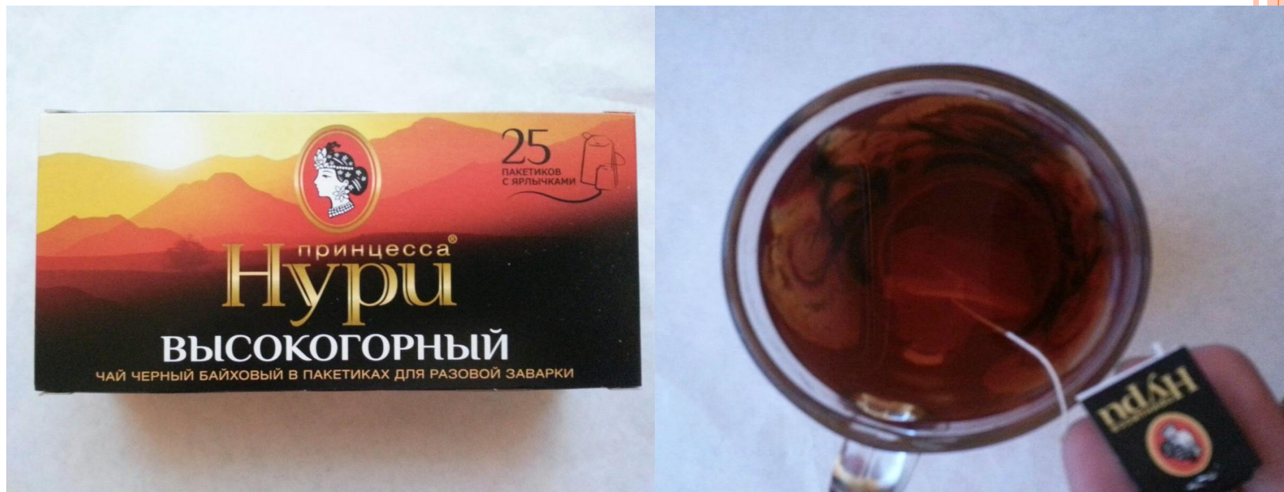
Чай черный «Принцесса Нури», изготовитель ООО «ОРИМИ»