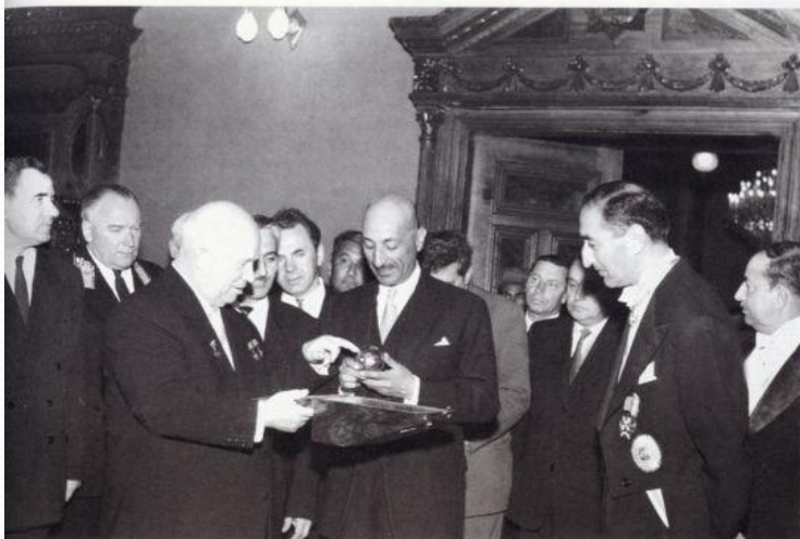
Хрущев в Афганистане