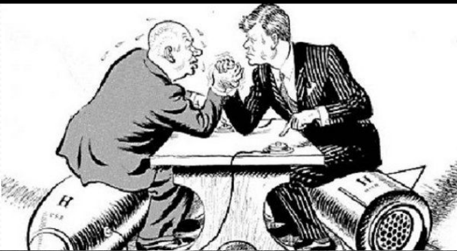
6 NOVEMBER 1962 CASILDA PORT