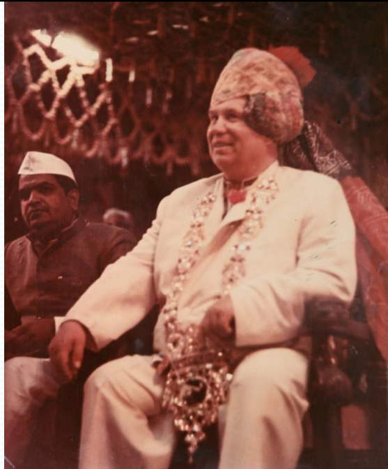
Хрущев в Индии