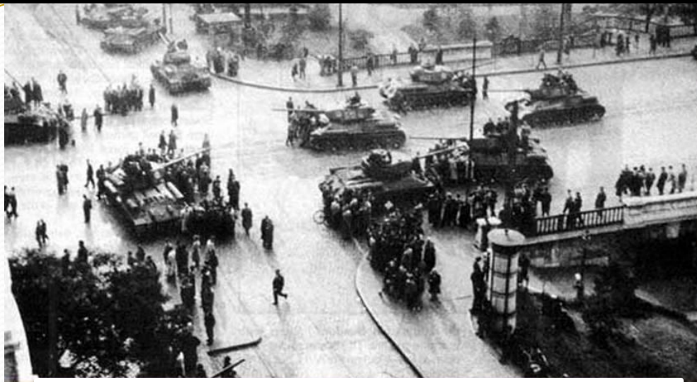
Советские танки на улицах Будапешта

ОВД 1955г. в составе СССР, Польша, Румыния, Венгрия, Чехословакия, Албания, ГДР, Болгария