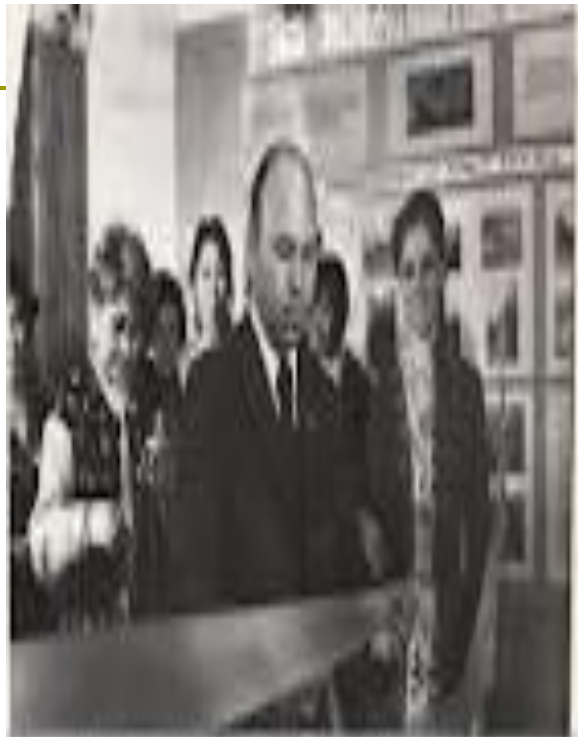
Тұңғыш Президентіміз Нұрсұлтан Назарбаевтің Қазақстан Республикасының Президенті болуының 10 жылдығына орай