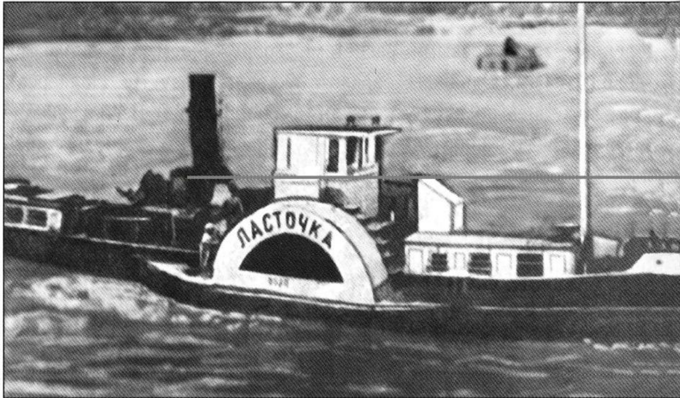
буксирный пароход «Ласточка»