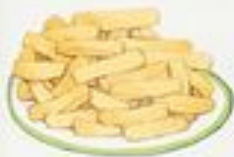
die Pommes frites*