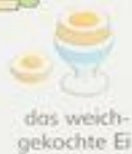
das weichgekochte Ei