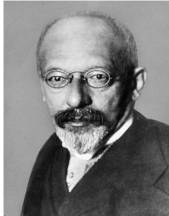
Георг Зиммель немецкий социолог