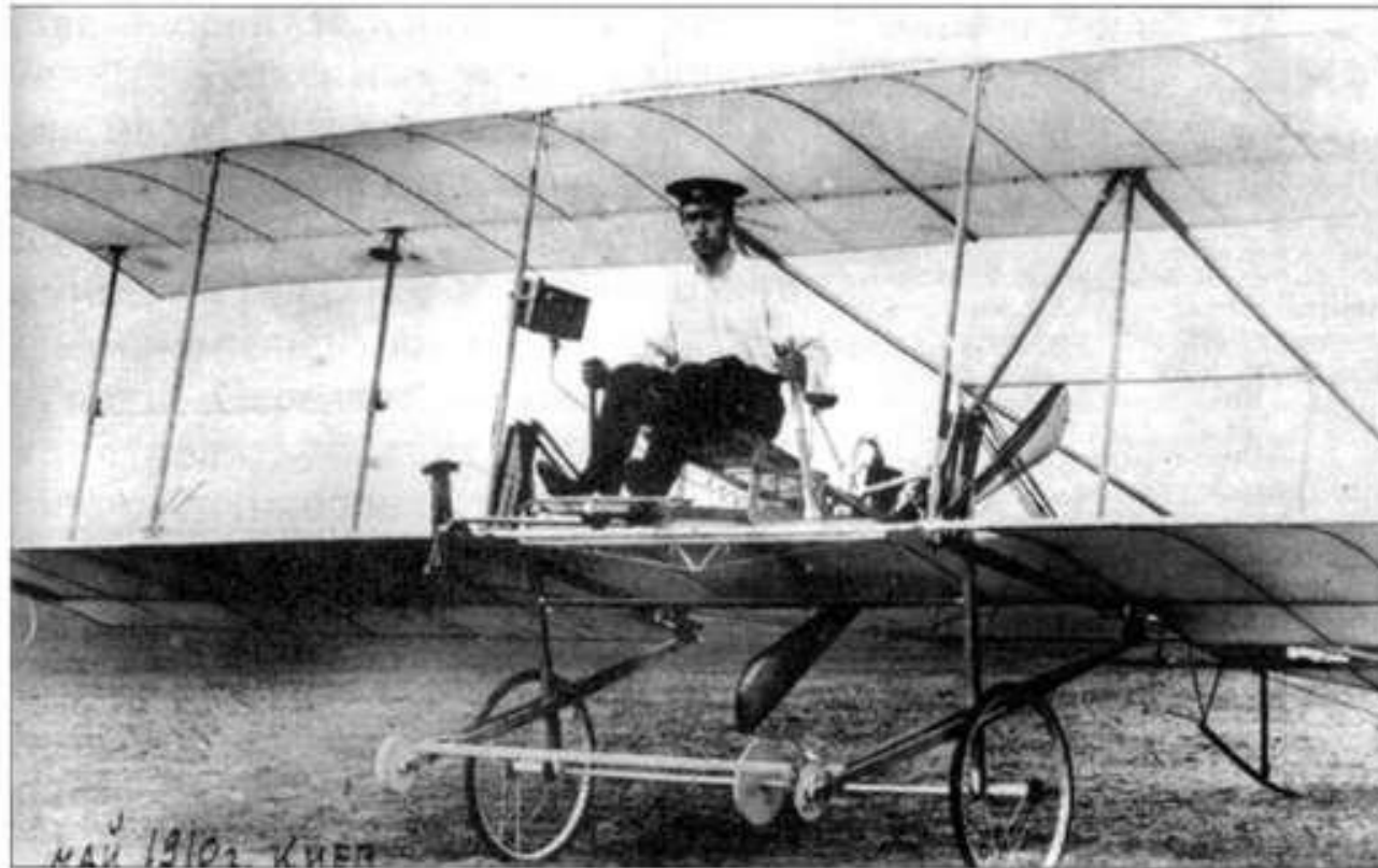
Студент КПІ Ігор Сікорський на літаку власної конструкції

І вже 1911 року піднявся в повітря на особисто сконструйованому літаку.