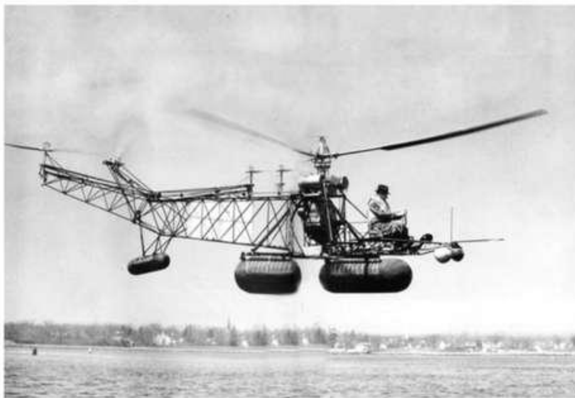
Ігор Сікорський під час випробувального польоту на гелікоптері VS-300А. 1941 рік.

А в 1941 році Ігор Сікорський побудував гелікоптер VS-300А