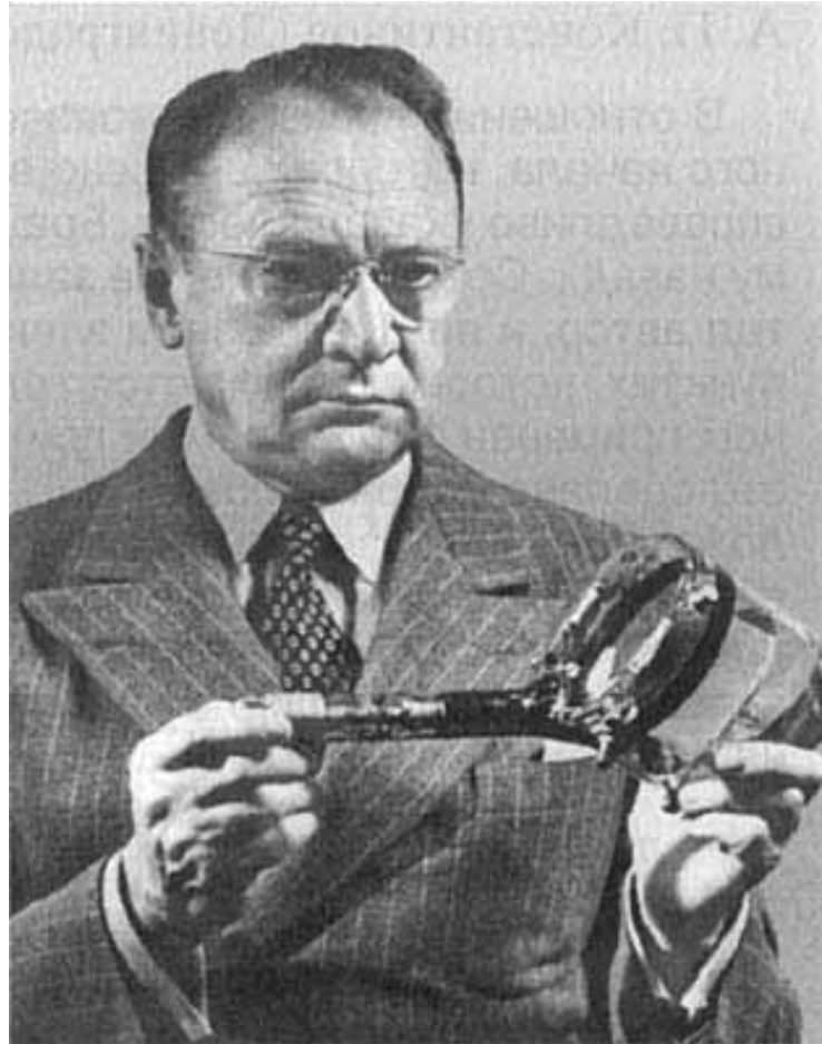
Мал. Зворикін з розробленою ним електронною телевізійною передавальною трубкою — іконоскопом, 1937