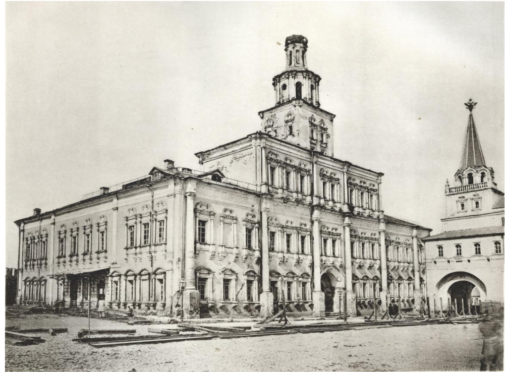
Древнее здание, въ которомъ былъ въ 1755 году открытъ Московскій Университетъ.