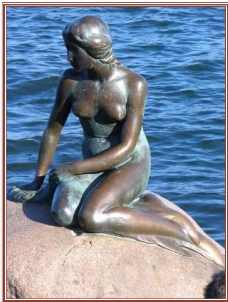
Памятник Русалочке в Копенгагене

Великому сказочнику и его героям поставлены памятники. А героиня сказки Х.К.Андерсена «Русалочка» стала символом столицы Дании – Копенгагена.