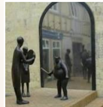
«НОВЫЙ НАРЯД КОРОЛЯ»