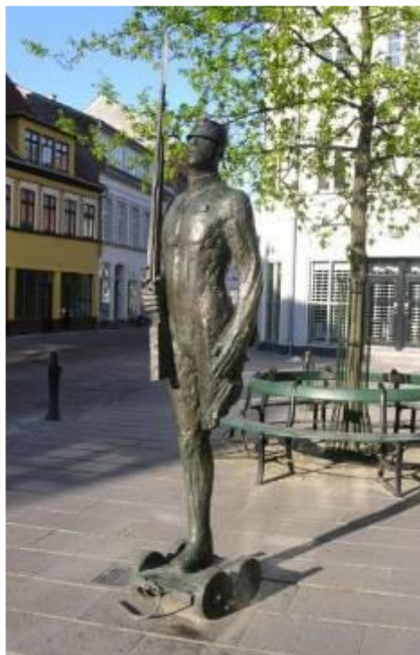
«СТОЙКИЙ ОЛОВЯННЫЙ СОЛДАТИК»