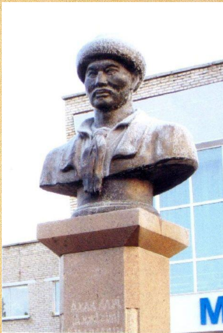
Бюст Ахана Сере, с. Саумалколь Айыртауский район