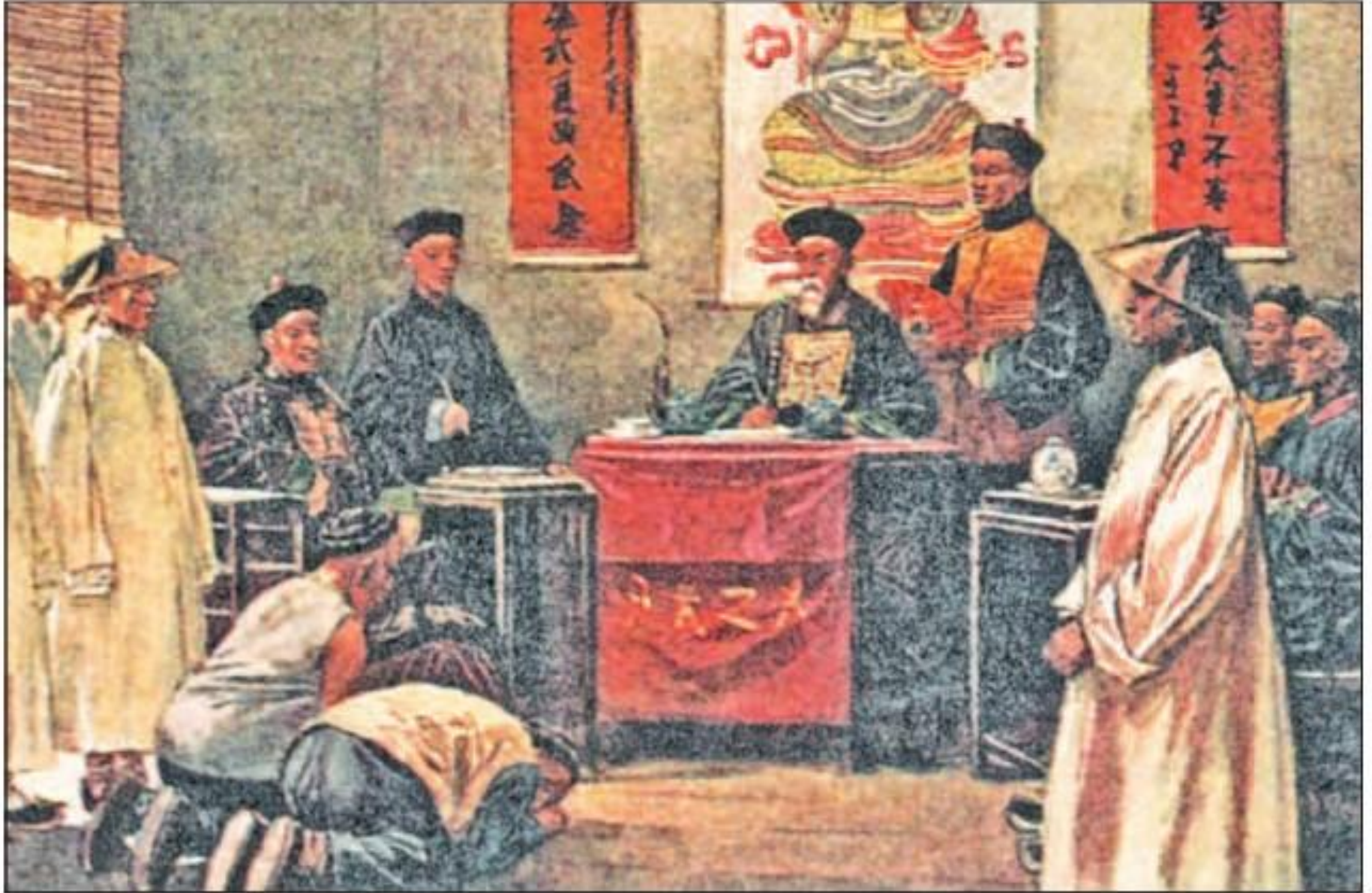
Маньчжурский чиновник принимает посетителей