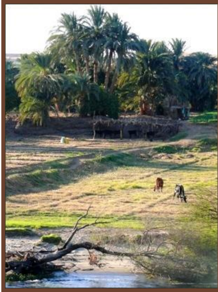
В долине Нила