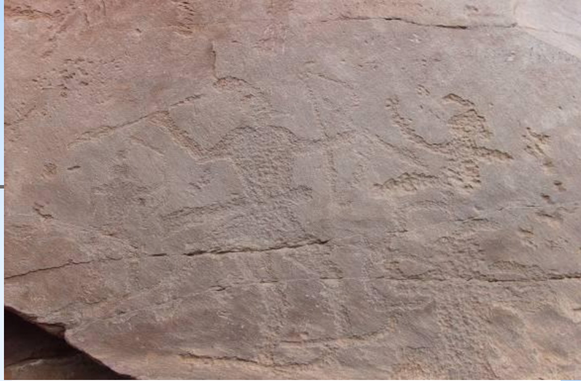
Наскальные рисунки – человек на лыжах