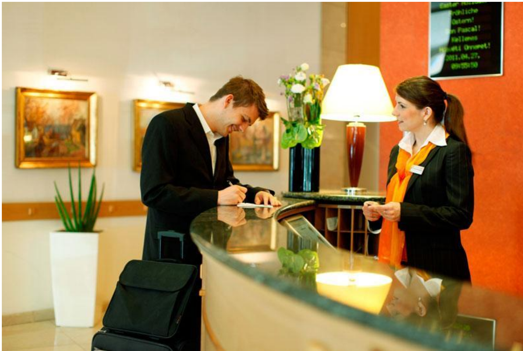
Продажа гостиничной услуги