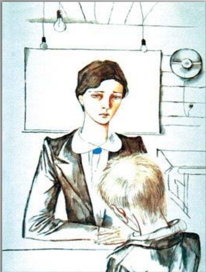
Гальдяев В.И. Иллюстрация к рассказу В.Г. Распутина "Уроки французского" (1981)