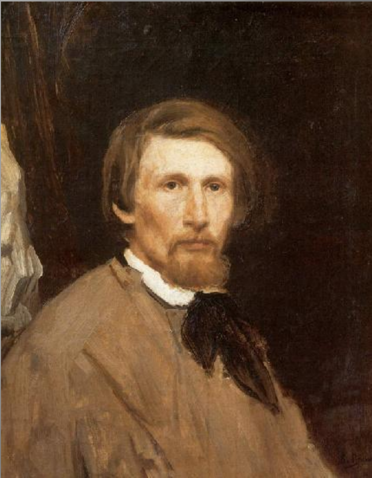
Виктор Михайлович Васнецов (1848 - 1926)

Васнецов Виктор Михайлович (1848 – 1926) – выдающийся русский художник, мастер живописи на исторические и фольклорные сюжеты.