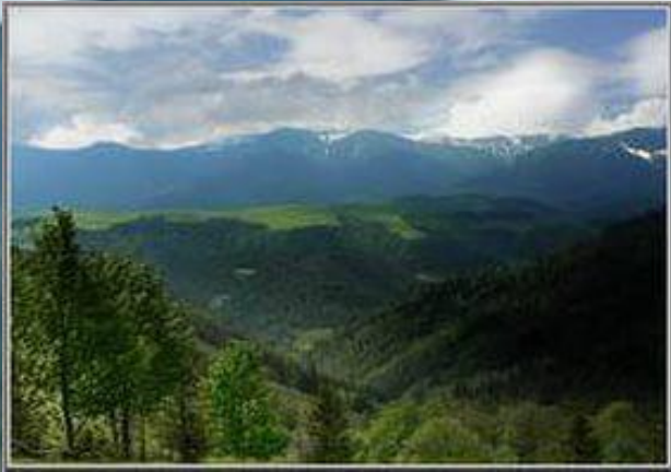
Чорногірський заповідний масив