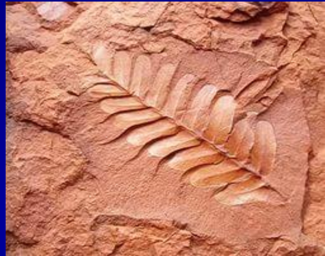
Відбиток доісторичного папоротника