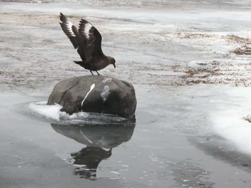
Південний полярний поморник