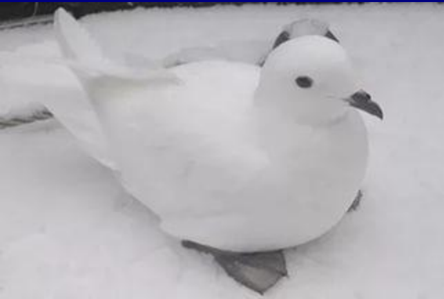
Південна фея (сніговий буревісник)

Всі птахи Антарктики океанічні, так як на закуту льодом суші практично немає корму. Вони пристосовані до добування їжі в море і до гніздування на суші.