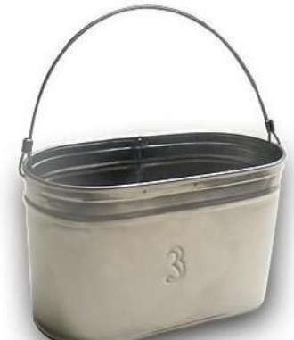
котлы или автоклав