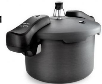
котлы или автоклав