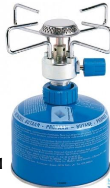
горелки и баллоны