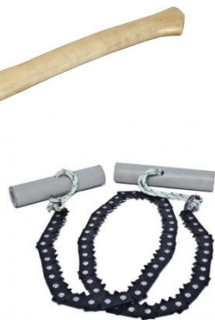
топор или тур. пила