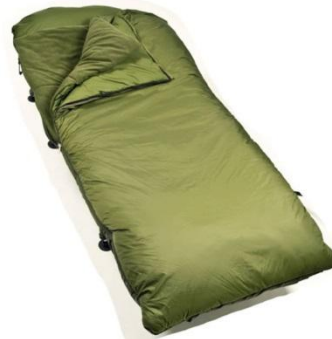
спальники если они общие