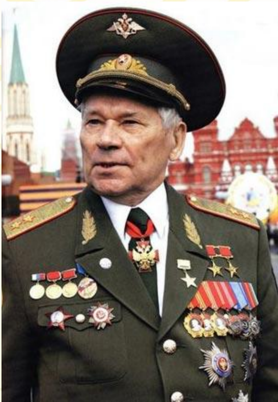
Михаил Тимофеевич Калашников