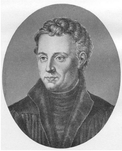
Иоганн Рейхлин (1455-1522)