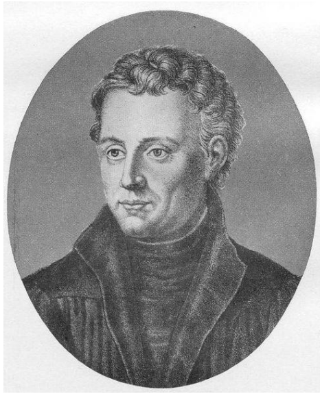
Иоганн Рейхлин (1455-1522)