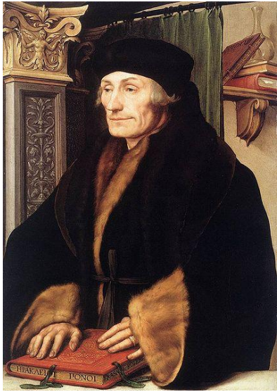
Эразм Роттердамски й