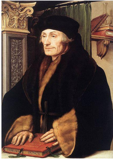
Эразм Роттердамский (1465-1536)