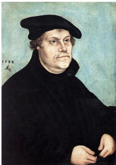
Мартин Лютер (1483-1546)