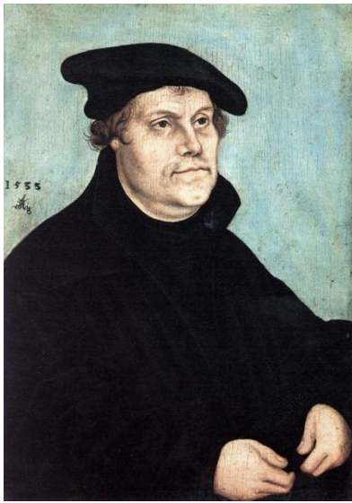
Мартин Лютер (1483-1546)