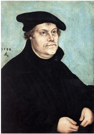
Мартин Лютер (1483-1546)