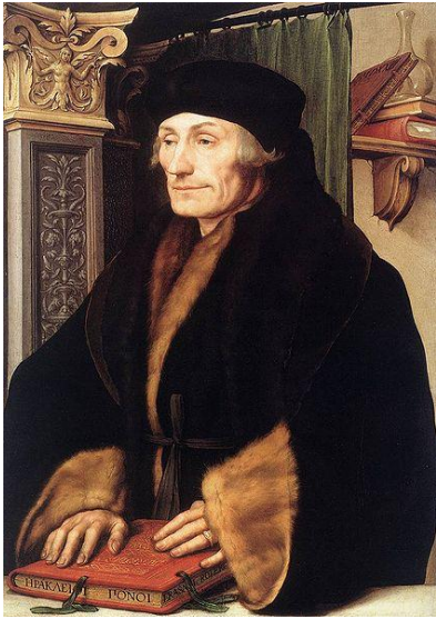
Эразм Роттердамский (1465-1536)