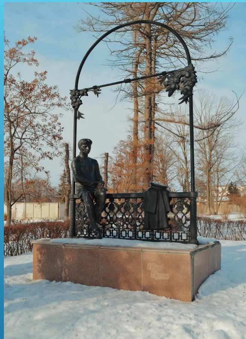
ПАМЯТНИК ИВАНУ БУНИНУ В ЕЛЬЦЕ