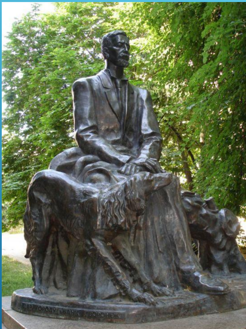
Памятник Ивану Бунину в Воронеже.