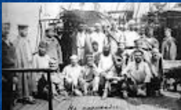
Каторжники на пароплаві

Письменник уважно стежив за змінами, що відбувалися в суспільстві й людських душах. Результати спостережень викликали в нього дедалі більшу тривогу за долю країни. У той час острів Сахалін був місцем каторги та заслання. Чехов їде на Сахалін. Там він побачив на власні очі, як людське життя можна перетворити на пекло. Він розповів про це в книзі " Острів Сахалін ", яка вразила читачів гнітючою правдою про людські страждання.