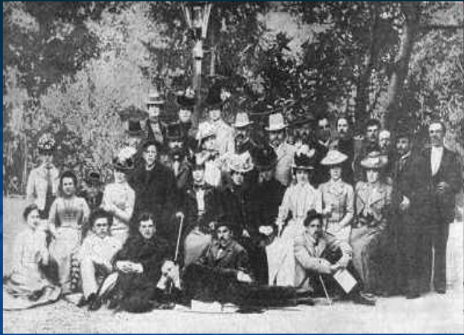
А.П.Чехов і трупа Художнього театру в Ялті. 1900 рік.