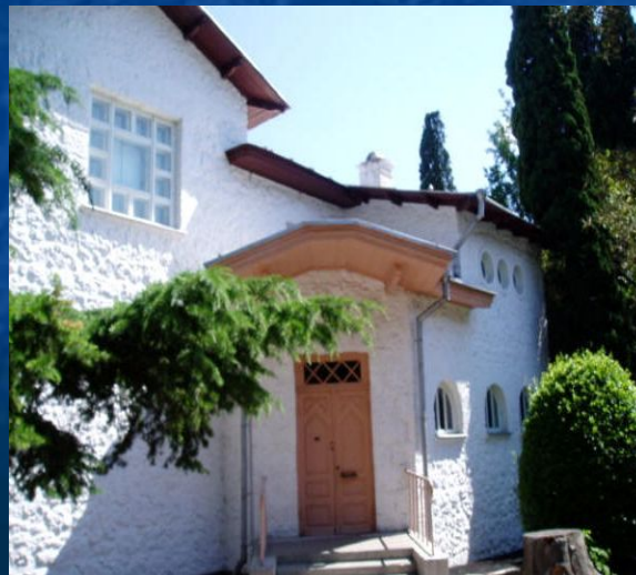
Дача в Ялті