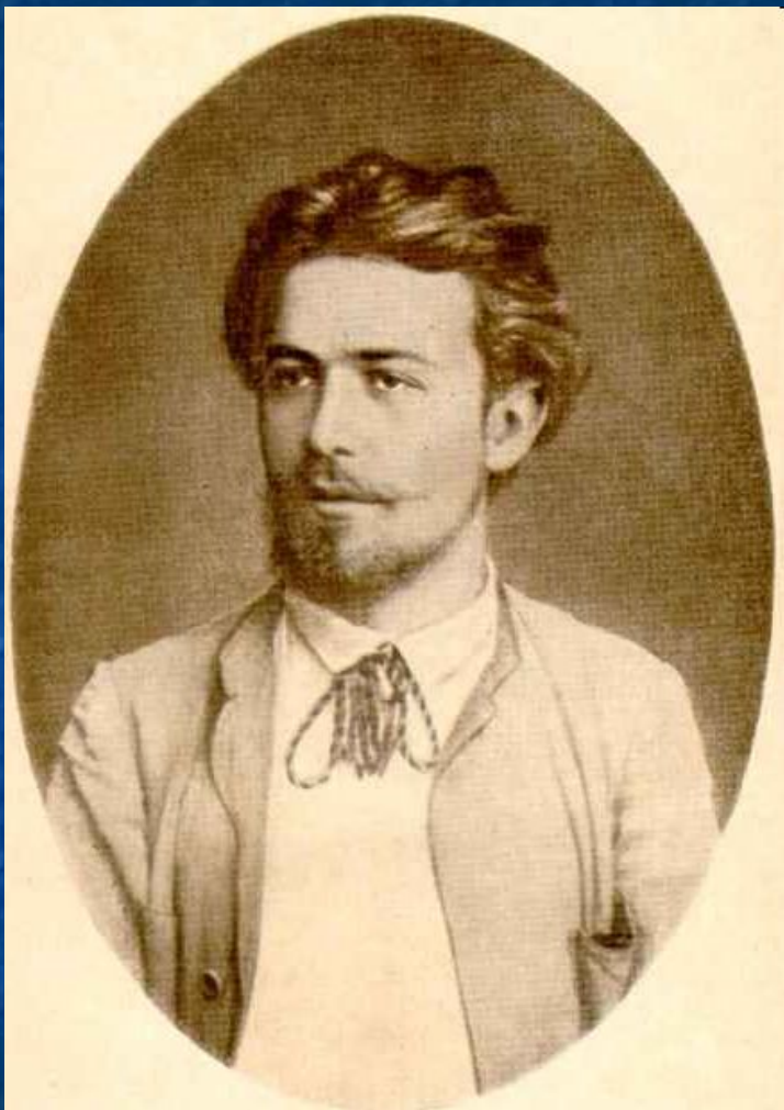
Фото 1888 р.

Але все більше його вабила літературна діяльність. Перші збірки оповідань ("Казки Мельпомени", "Строкати оповідання") були схвалені критикою. Чехов починає друкуватися у відомій столичній газеті "Новое время". Згодом про нього заговорили як про талановитого драматурга. 1888р. Академія наук нагородила Чехова Пушкінською премією за збірку оповідань "У сутінках".