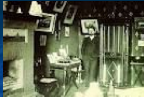
В ялтинському кабінеті