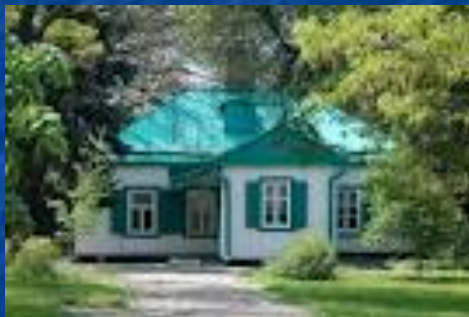
Будинок у Таганрозі

Народився А.П.Чехов 29 січня 1860 р. в м. Таганрозі в родині купця, помер в Германії 15 липня 1904 р. на південному курорті від сухот, похований в Москві. В родині було 6 талановитих дітей: Олександр – літератор, лінгвіст, Микола – художник, Антон – письменник, Іван – учитель, Михайло – юрист, Марія - художниця.