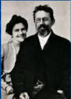
А.П.Чехов з дружиною Ольгою Кніппер