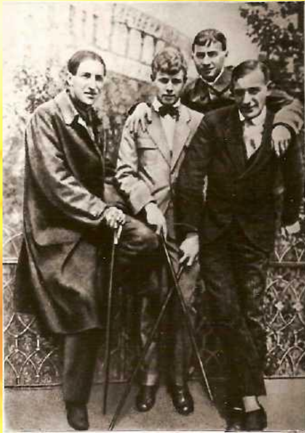
С. А. Есенин среди имажинистов.