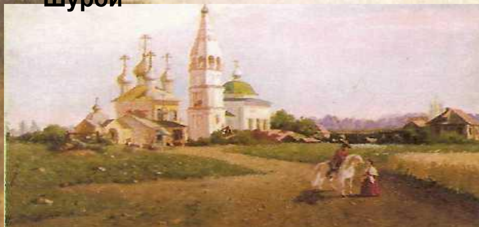
Окрестности села Константиново