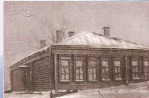
Константиновское земское училище

С 1904 по 1912 год учился в Константиновском земском училище и в Спас-Клепиковской школе. За это время им было написано более 30 стихотворений, составлен рукописный сборник «Больные думы» (1912), который он пытался опубликовать в Рязани. «Береза» - первое напечатанное стихотворение С. Есенина. С первых же стихов в поэзию Есенина входят темы родины и революции. Поэтический мир