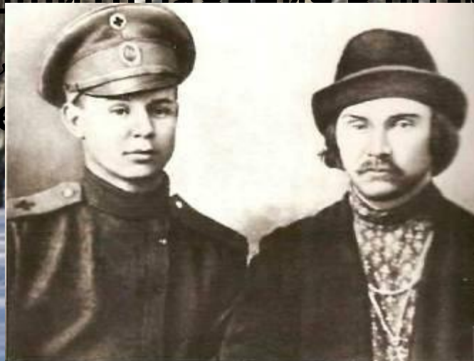
С. А. Есенин и Н. А. Клюев