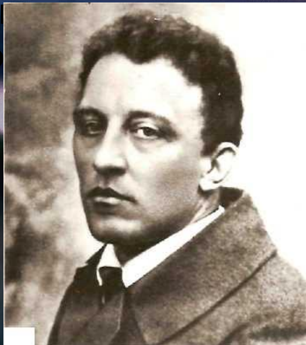
А. А. Блок Фотография. 1916