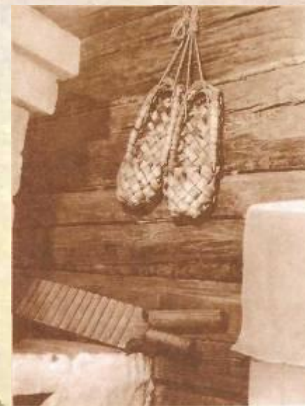
Интерьер дома- музея