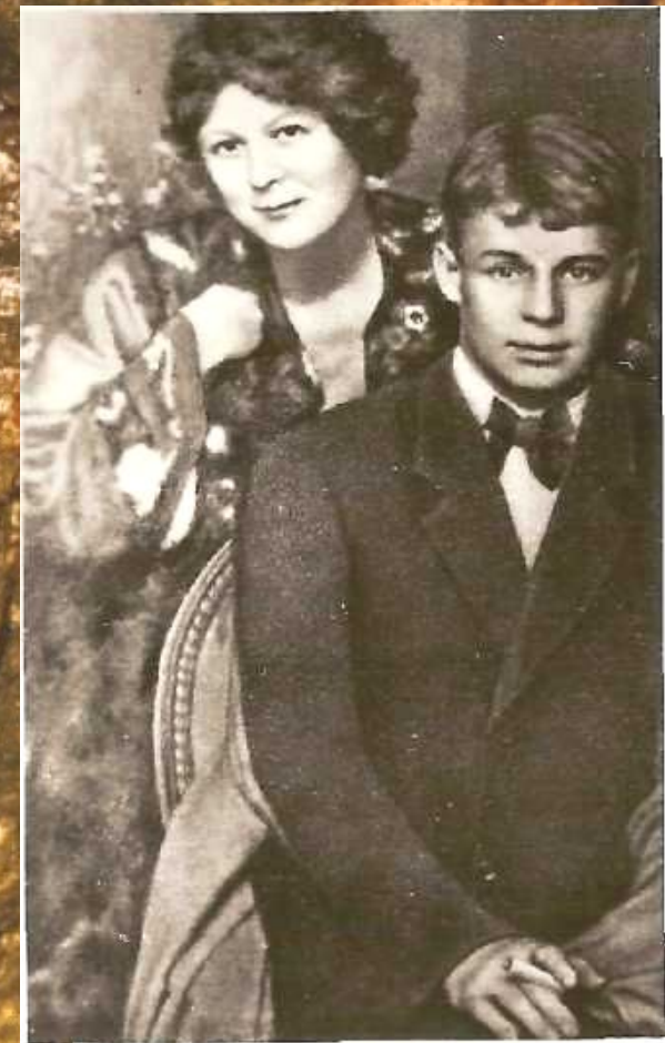
С. А. Есенин и А. Дункан Фотография. 1922 г.