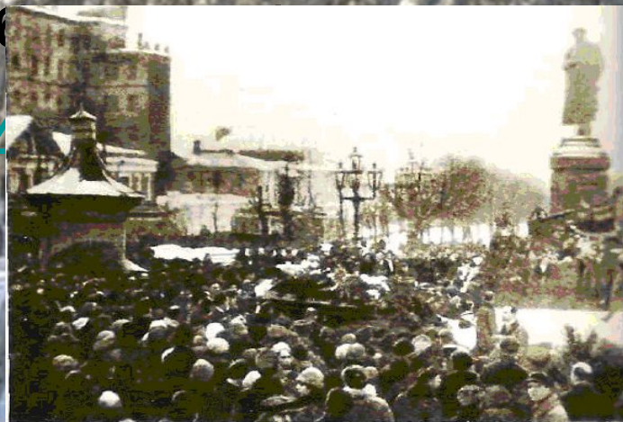
Похоронная процессия у памятника Пушкину. Москва