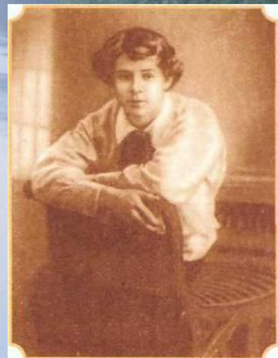
С.Есенин 1913—14 год