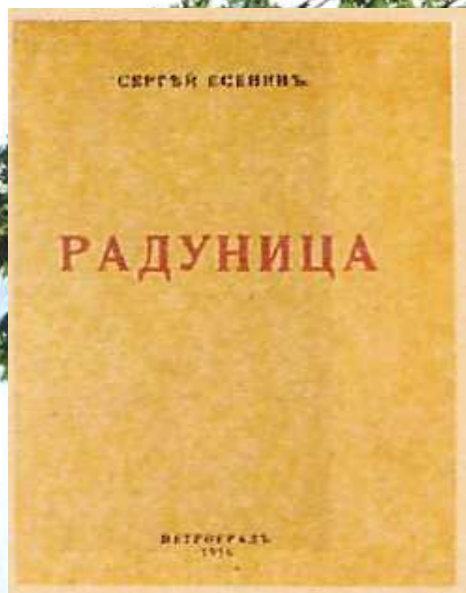
С. Есенин. Обложка. "Радунца", 1916г.

В начале 1916 года выходит первая книга «Радунца» , в которую входят стихи, написанные Есениным в 1910-1915 годах. Есенин позже признавался: «Моя лирика жива одной большой любовью, любовью к родине. Чувство родины - основное в моем творчестве». Один из основных законов мира Есенина - это всеобщий метаморфизм. Люди, животные, растения, стихии и предметы - все это, по Есенину, дети одной матери-природы. Он очеловечивает природу. Книга пропитана фольклорной поэтикой (песня, духовный стих), ее язык обнаруживает немало областных,