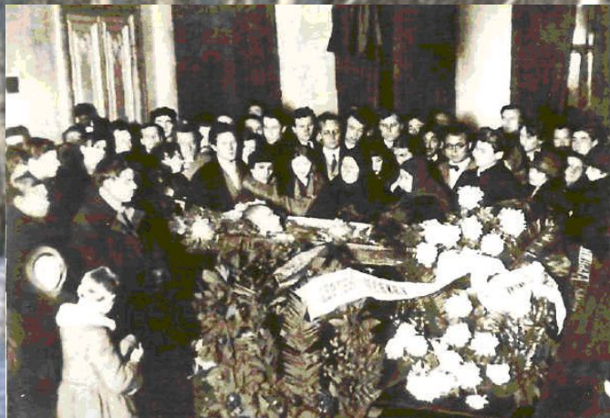
У гроба С. А. Есенина в Доме Печати.

Жизнь С.А. Есенина трагически оборвалась в Петрограде, в гостинице «Англетер» при невыясненных обстоятельствах. Поэта нашли повешенным. После гибели Есенина начался период официального забвения его творчества. В 1927 году появилась статья Бухарина «Злые заметки». Творчество поэта было признано мелкобуржуазным, кулацким, не соответствующим великой эпохе. Статья на много лет стала идеологической основой для