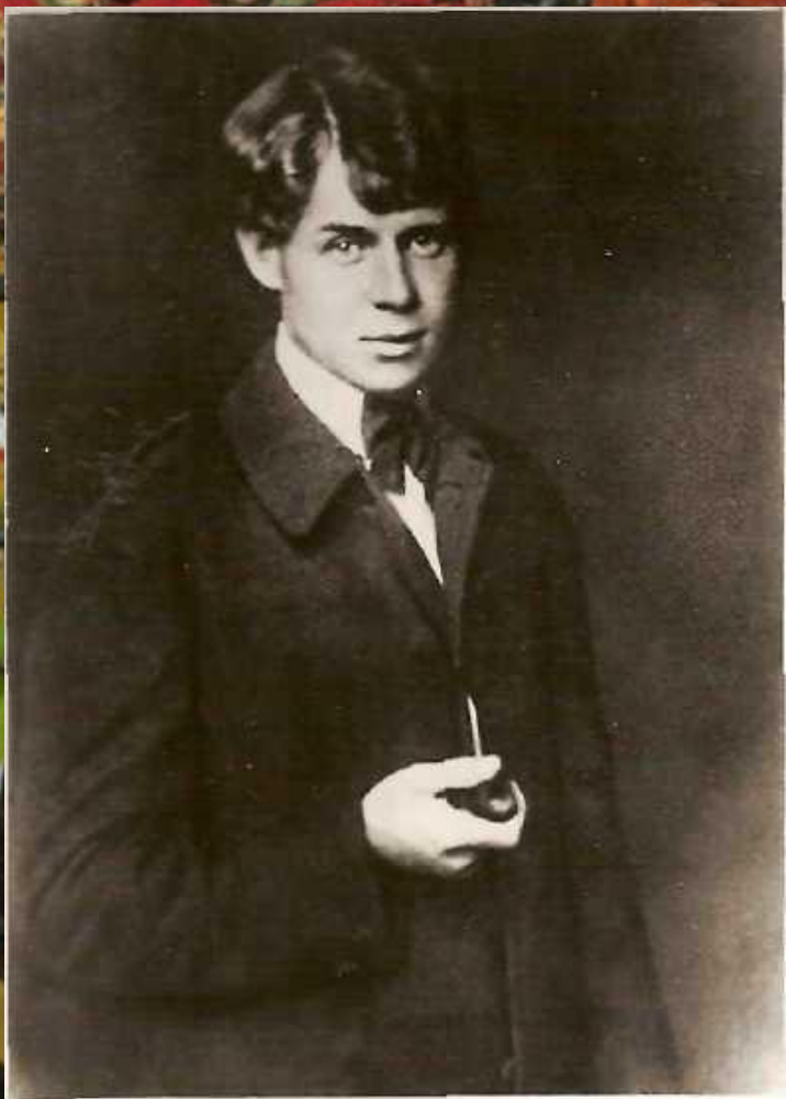
С. А. Есенин. Фотография

В ноябре 1925 года поэт закончил автобиографическую, исповедальную поэму «Черный человек», которая оказалась последней в ряду написанных им поэм, а среди них были такие значительные, как «Пугачев» (1921), «Страна негодяев» (1922-1923), «Песнь о великом походе» (1924), «Анна Снегина» (1925). Некоторое время Есенин находился в бакинской